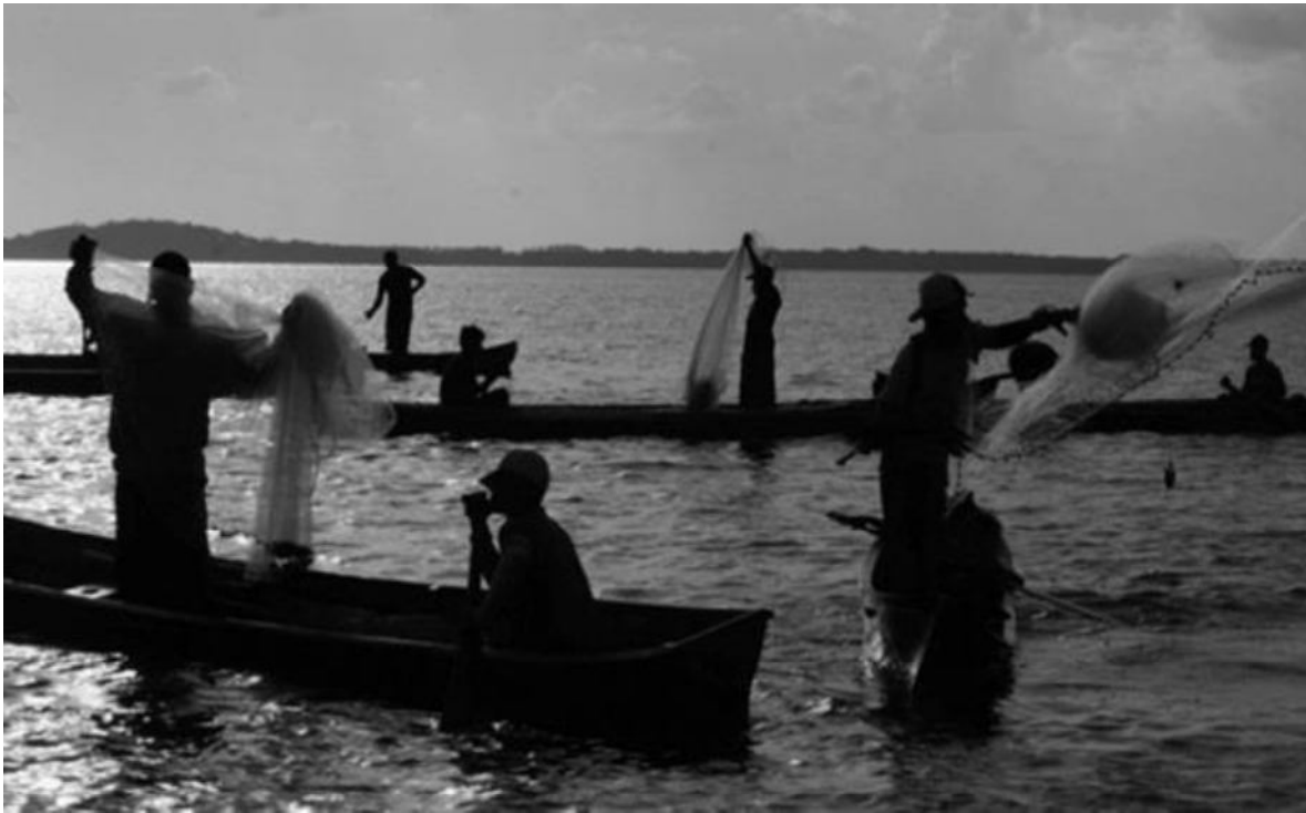
Pescadores en la Laguna de Bluefields.